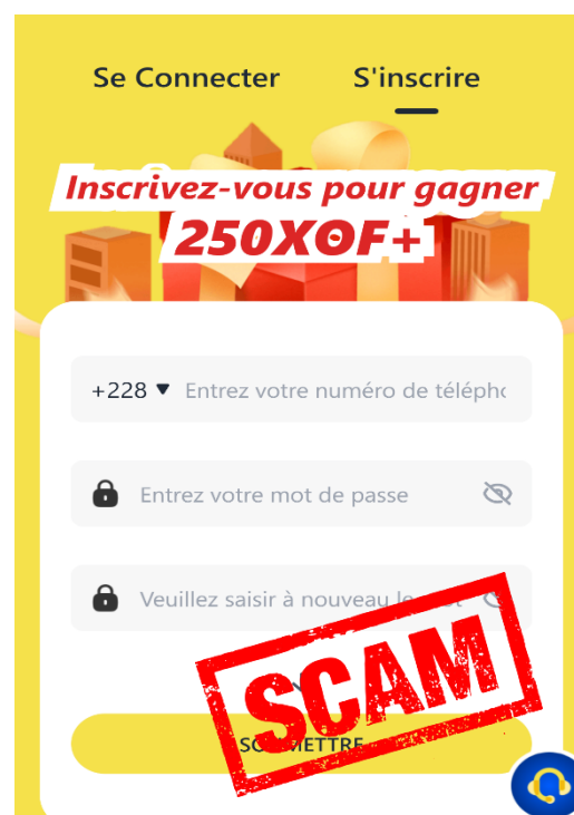
Figure 2 : 2 è Plateforme d'investissement frauduleux. A éviter catégoriquement